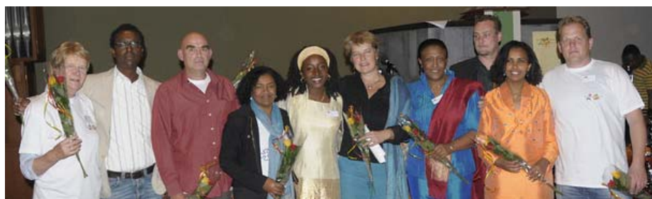
Organisatoren en vrijwilligers van Ontmoetingsdag op 4 oktober 2008