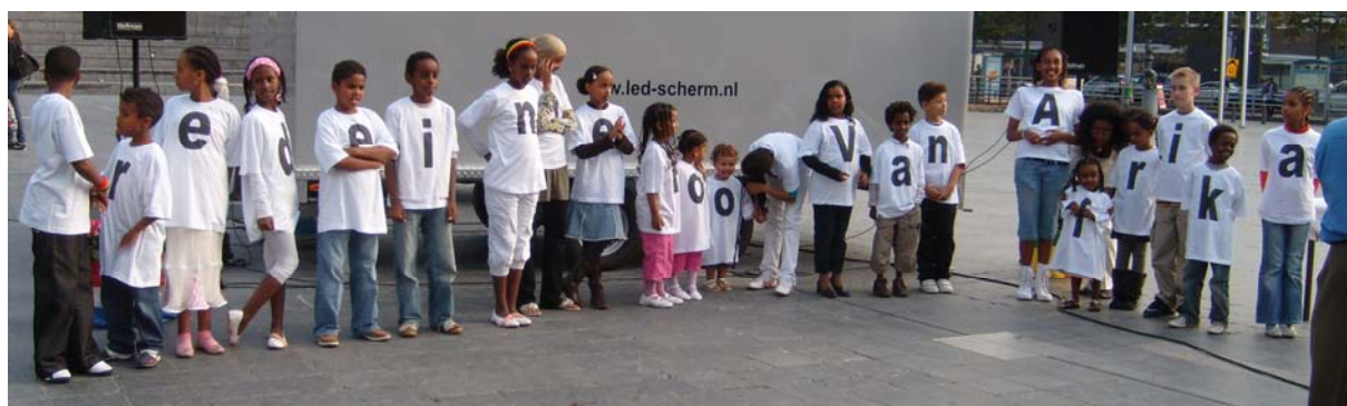
Cry for Peace op 12 september 2007 in Den Haag